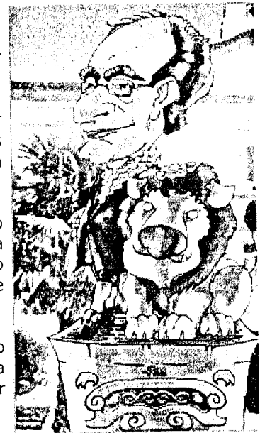
O Marquês do Fundão

Recorde-se que o trânsito na Rua Direita foi proibido em 2003, depois das obras de remodelação da artéria comercial. Na altura, colocou-se os obstáculos de ferro (vulgarmente designados por "pinocos") para impedir o estacionamento.